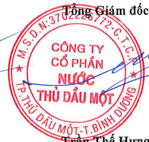
Trần Thế Hưng